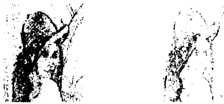
图3 一般方法 图4 预处理-修正方法