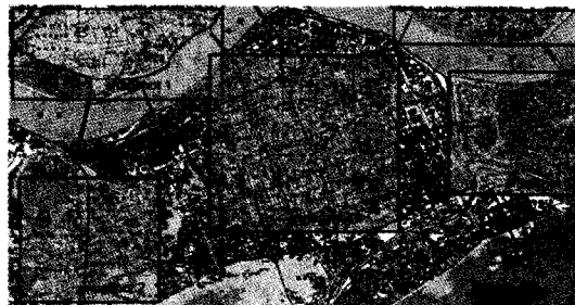
图4 在电子地图中创建快照

息的电子地图。由实际情况可知,电子地图中的数据通常是定期维护,并不需要被随时刷新。因此,如果某个明确的区域被用户频繁地查询,那么系统就可以通过把该区域涉及的数据从电子地图中抽取出来放在主存中创建快照。之后,当用户查询再次涉及该区域时,系统就能迅速地通过快照返回结果,而无需再到数据库中去查找相应的数据。在图4中,给出了从电子地图中抽取数据创建快照的例子。