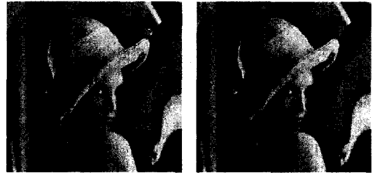
图 6 本文算法与 JPEG2000 有损算法重建图像的比较,左图为本文算法,右图为 JPEG2000 有损算法(0.2BPP)

RCT 和 CDF 9/7 小波变换的组合,其二是颜色分量加权,其三是颜色对比度敏感函数滤波。实验结果表明,相比 JPEG2000 有损变换算法和 JPEG2000 无损变换算法,本文方法极大地提高了基于小波变换的彩色图像压缩算法的客观质量和视觉质量。