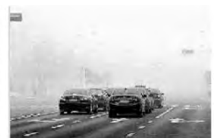
图 6 采用改进方案 2 增强之后的图像