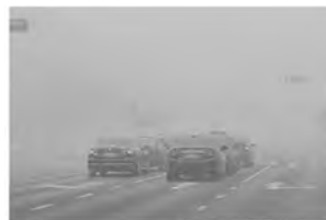
图 3 待增强图像

图 3 为待处理图像,图 4 为采用原始 Retinex 算法(SSR)增强之后的图像,可以看出去雾效果相当有限,而且在车身与其周围出现了很明显的光晕。表 1 表明增强前后的信息熵也几乎没有变化。这说明由于对较亮处处理不佳,且在灰度变化大的地方会出现非常明显的光晕,因此传统 Retinex 算法的去雾效果相当有限。