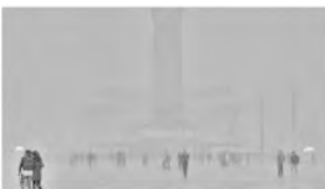
图 9 采用改进方案 1 处理