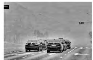
图 4 原始 Retinex 算法增强之后的图像