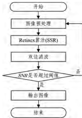
图 1 改进方案 1 的流程图

首先,针对 Retinex 算法对较亮图像的处理效果欠佳的问题,考虑在处理前先进行反色处理。然后,为了减少光晕,寻找一个合适的低通滤波算子是非常重要的,该低通滤波算子应该具有良好的边缘保持特性,利用该低通滤波算子估计出来的光照成分可以反映图像的整体结构。考虑到双边滤波同时利用了当前点和邻域像素点的空间相似性和灰度值相似性,可以使其较好地考虑到图像中光照突变的现象,从而在一定程度上克服光晕现象,因此使用双边滤波来快速估计光照图像。现将此方案称为改进方案 1,其流程图如图 1 所示。