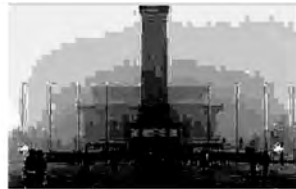
图 8 采用原始 Retinex 算法