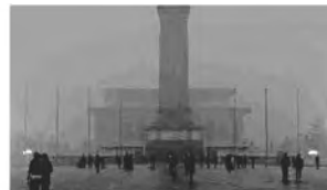
图 10 采用改进方案 2 处理