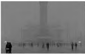
图 7 增强之前