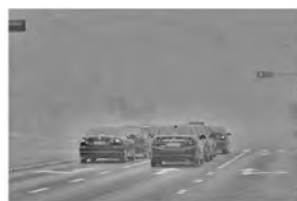
图 5 采用改进方案 1 增强之后的图像

采用了改进方案 1 增强之后,车身周围的光晕得到了一定程度的改善,且去雾也有了一定的效果,如图 5 所示。从表 2 中信息熵的对比可以看出,通过改进方案 1,图像的信息熵有了一定程度的提高。采用了改进方案 2 之后,车身周围的光晕基本消失,去雾效果也令人满意,如图 6 所示,从信息熵也能看出,采用改进方案 2 增强之后的图像的信息熵得到了显著的提高。