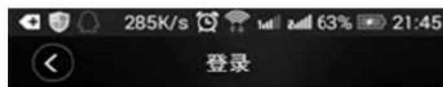
图 2 系统登录界面

图书阅读推荐系统基于 Android 移动平台, 利用 IntelliJ IDEA 开发工具, 使用 Java 语言实现, 系统提供了图书浏览、图书查询、图书阅读、图书推荐等功能。系统登录界面、图书推荐界面分别如图 2、图 3 所示。