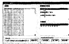
图 2 粗糙集属性约简结果视图

对约简表进行决策树算法学习并进行规则挖掘,得到图像情感语义规则集;采用了基于 JAVA 环境下的机器学习和数据挖掘软件 weka (Waikato Environment for Knowledge Analysis) 软件来实现。系统输出图像情感语义决策树如图 3 所示。并在此基础上采用较为常用的 C4.5 算法构造决策树,同时对照实验,对决策树规则进行极小极大规则学习。