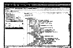
图 3 图像情感语义决策树

对规则集进行本文中给出的极小极大规则学习,便可以得到约简的图像情感语义规则集。规则约简结果如图 4 所示。